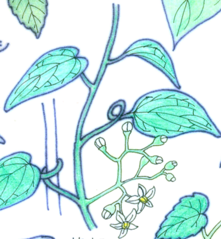
葉柄 ヒョドリジョウゴ