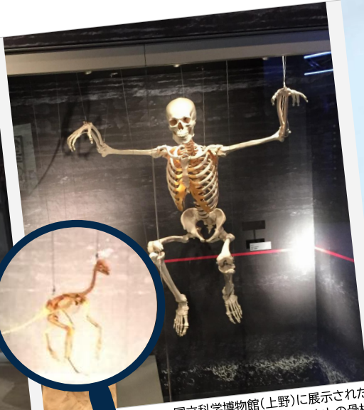
国立科学博物館(上野)に展示されたジュラ紀後期の始祖鳥と現代のヒトの骨格